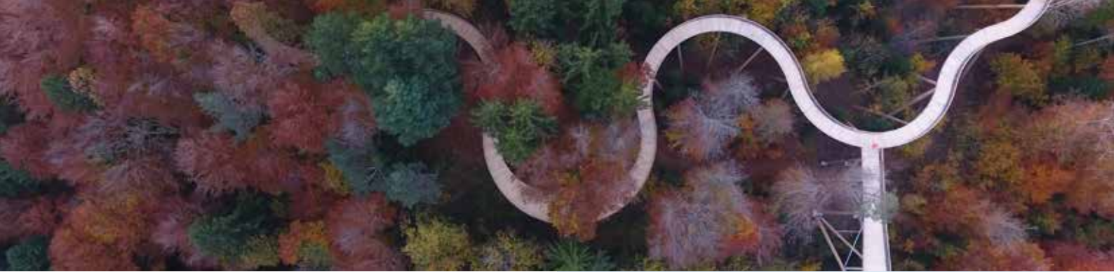
Baumwipfelpfad Neckertal / Neckertal tree-top trail