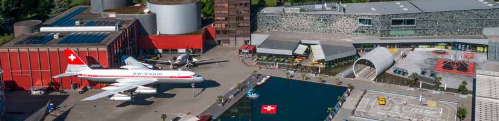
Verkehrshaus der Schweiz / Swiss Museum of Transport