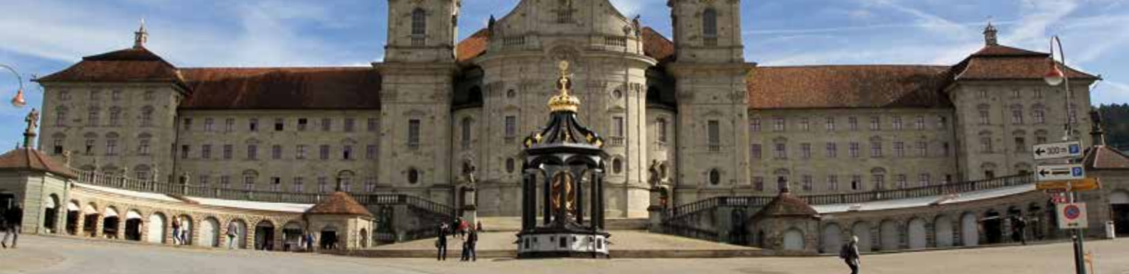
Kloster Einsiedeln / Einsiedeln Abbey