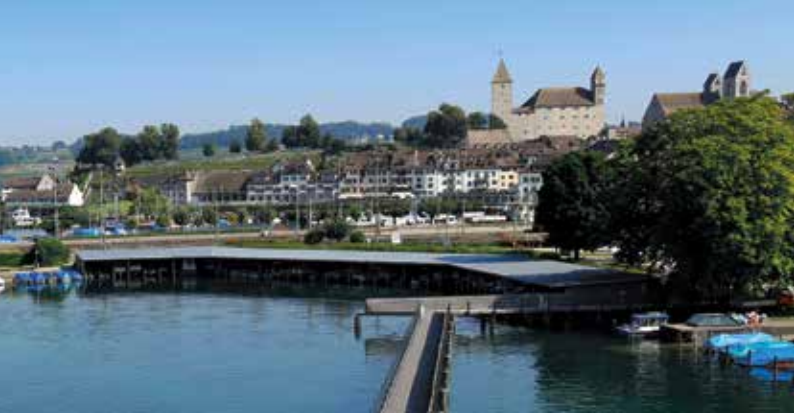
Seedamm, la digue du lac à Rapperswil/Ponte-diga Seedamm di Rapperswil