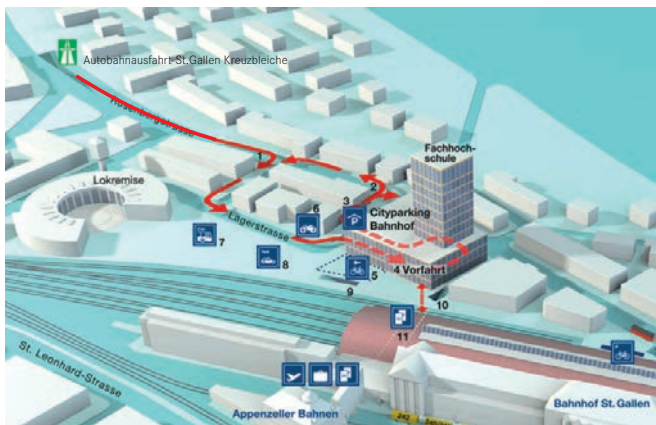
Anfahrtsplan Busparkplätze St. Gallen