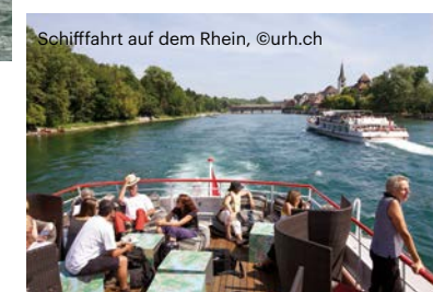
Schifffahrt auf dem Rhein